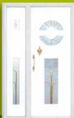
S25 - Pariz