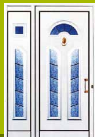
S31 - Kragujevac