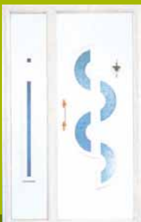
S32 - Zagreb