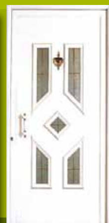
S27 - Atina