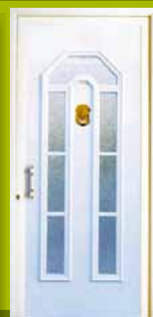
S17 - Prag