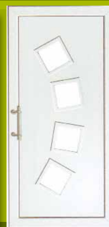
S18 - Beč