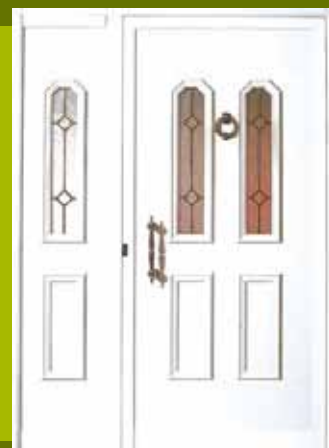
S4 - Dablin