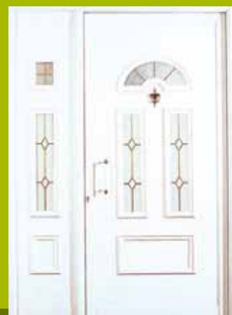
S8 - Beograd