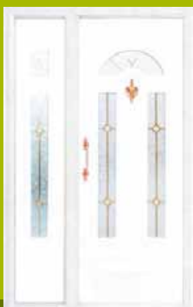
S23 - Glazgov