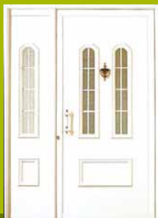
S6 - Novi Sad