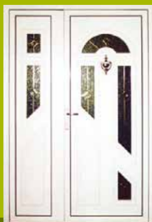
S29 - Niš