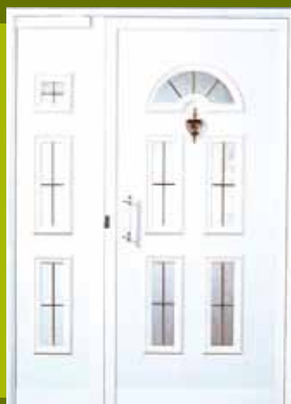
S3 - Briž