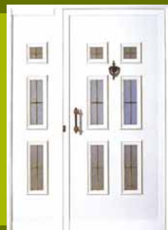
S22 - Keln