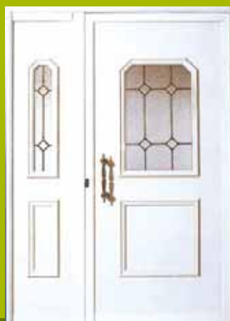
S11 - Malme