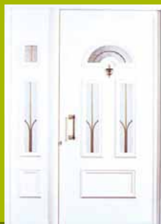
S10 - Madrid