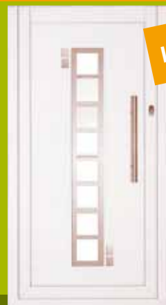
S35 - Rim