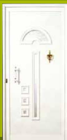
S16 - Barselona