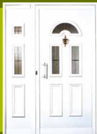
S2 - Milano