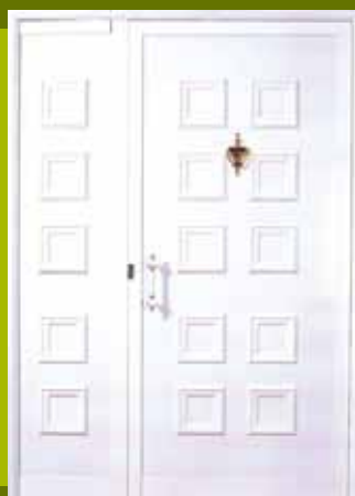
S21 - Kijev