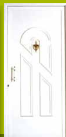
S15 - Monako