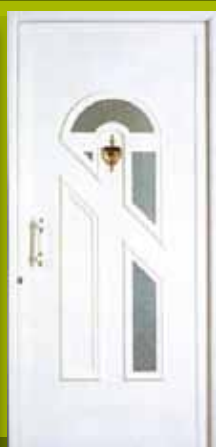
S14 - Porto