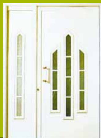
S12 - Minsk