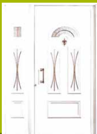
S9 - Bremen