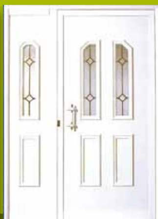
S24 - Verona