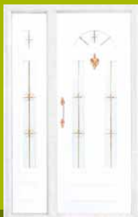
S33 - Krakov