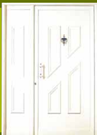
S19 - Ljubljana