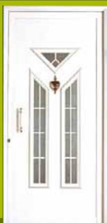
S13 - Oslo