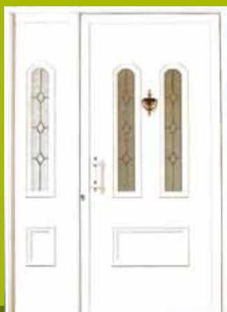
S5 - London