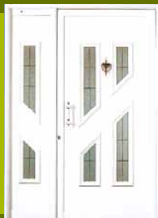
S20 - Sofija