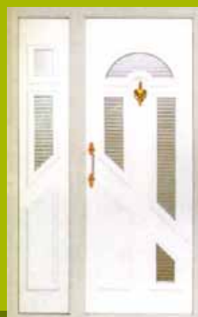
S30 - Lisabon