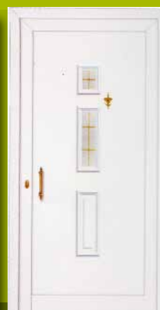
S34 - Solun