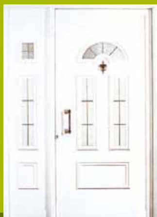
S7 - Firenca