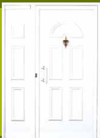
S1 - Skoplje